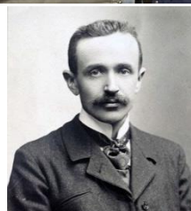
Expo Adolphe Kégresse (photos et panneaux archives de VINCENT CHAMON)